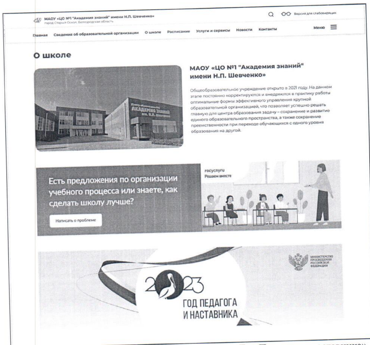
Рис.1. Реализация информационного баннера «Год Педагога и наставника»